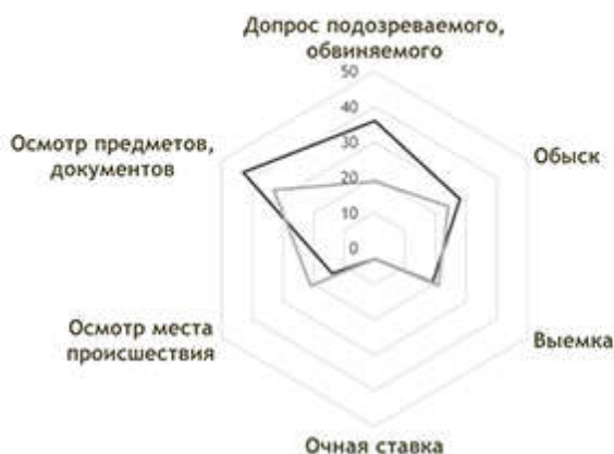
Рисунок 3. Необходимые и реально используемые формы участия специалиста в следственных действиях

—целесообразно и необходимо — реально используется на практике