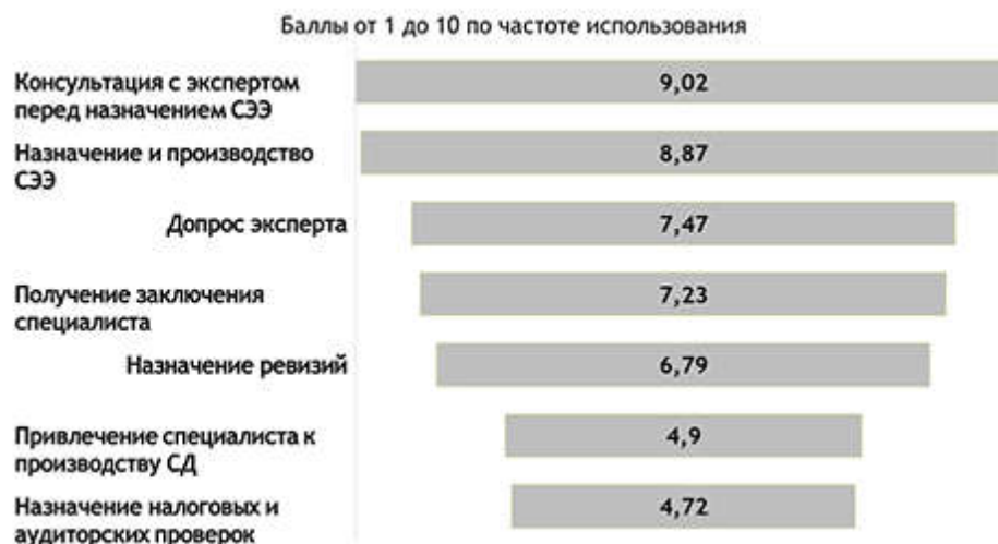
Рисунок 2. Частота использования различных форм применения специальных экономических знаний

и производство судебных экономических экспертиз – 8,87; допрос эксперта – 7,47; получение заключения специалиста – 7,23; назначение и производство ревизий – 6,79; привлечение специалиста к производству следственных и иных процессуальных действий – 6,22; консультации со специалистами-экономистами при подготовке к допросу (подозреваемого, обвиняемого и др.) – 5,97; привлечение специалиста для оказания помощи в оценке заключения эксперта и допросе эксперта – 4,9; назначение и производство аудиторских и налоговых проверок – 4,72.